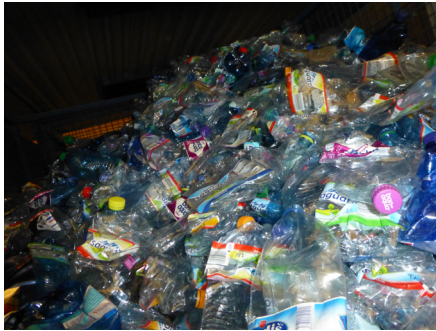
Output materiale - PET blå