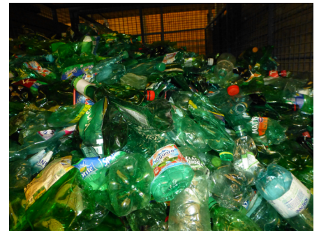
Output materiale - PET grøn