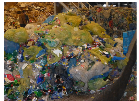
Input materiale - Blandet plastik