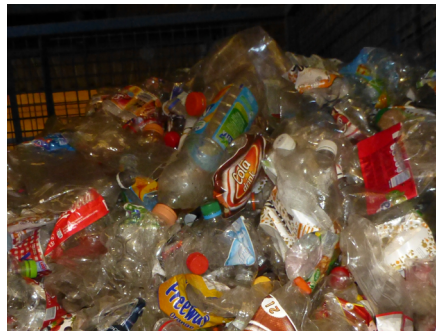
Output materiale - PET klar